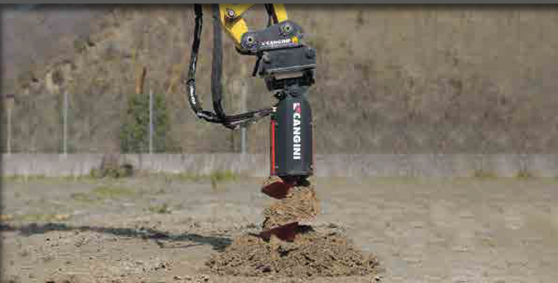
HYDRAULISCHER ERDBOHRER MIT PLANETENGETRIEBE FÜR BAGGER UND ANBAUBAGGER. DER BOHRER KANN IM UND GEGEN DEN UHRZEIGERSINN LAUFEN. ER IST MIT EINEM DOPPELGELENK UND MASCHINENAUFNAHME AUSGESTATTET. AUF ANFRAGE KÖNNEN AUCH LÄNGERE BOHRER GEFERTIGT WERDEN